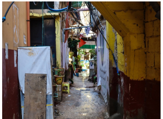
PHOTO DE MAR ELIAS